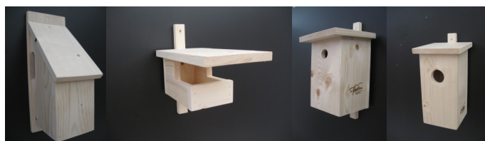
Boomkruiper, vliegenvanger, mezen, specht