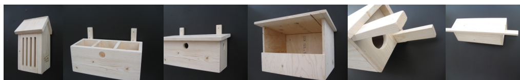
vlinder, mussen, valk, steenuil

Daar Innogreen BV over het gebruik, de opslag alsmede het onjuist toepassen van haar producten geen controle kan uitoefenen, kan geen aansprakelijkheid aanvaard worden voor verminderde werking of eventuele schade.